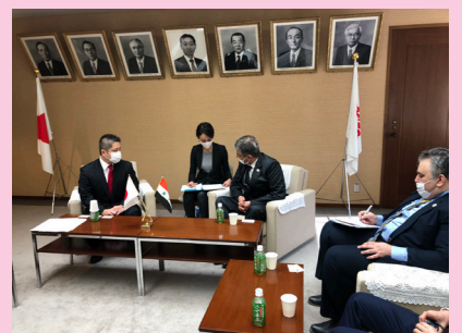
シリア臨時代理大使の表敬訪問