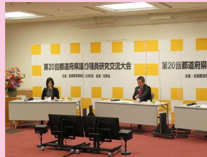
都道府県議員政策研究大会にて講演