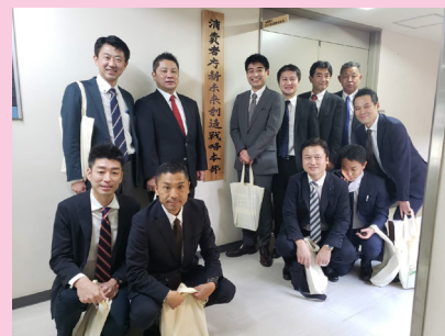
消費者庁未来創造戦略本部を視察