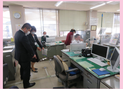
県地方庁舎等の現状調査