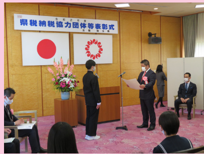
県納税団体等表彰式にて賞状授与