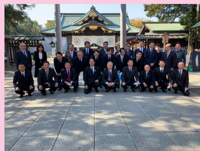
英霊にこたえる議員連盟靖国神社参拝