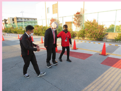
モビリティ体験講習に参加