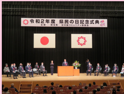
県民の日記念式典にて挨拶